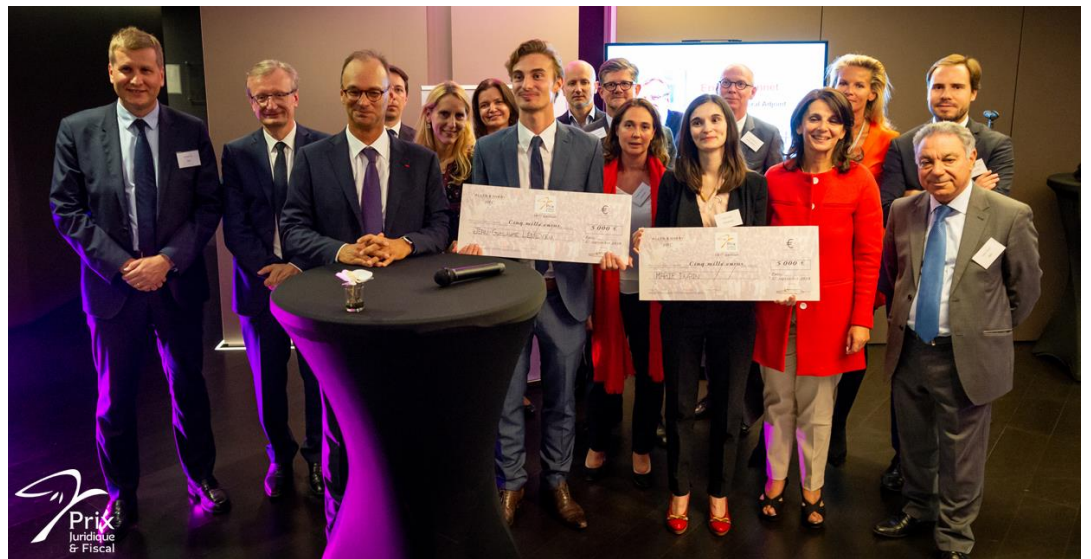
Cérémonie de remise des prix - 15 ème édition du Prix Juridique et Fiscal Allen & Overy/HEC