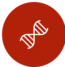
LIFE SCIENCES GESUNDHEITSWESEN