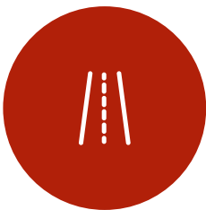
INFRASTRUKTUR & TRANSPORTWESEN