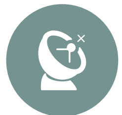
TELEKOMMUNIKATION, MEDIEN & TECHNOLOGIE