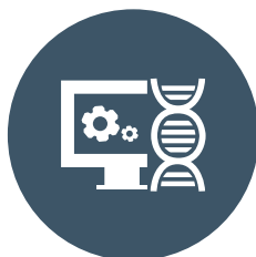
LIFE SCIENCES GESUNDHEITSWESSEN