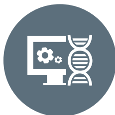
LIFE SCIENCES GESUNDHEITSWESEN