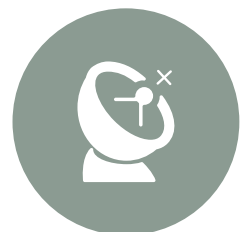
TELEKOMMUNIKATION, MEDIEN & TECHNOLOGIE