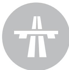
INFRASTRUKTUR & TRANSPORTWESEN