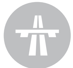
INFRASTRUKTUR & TRANSPORTWESEN