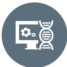
LIFE SCIENCES GESUNDHEITSWESEN