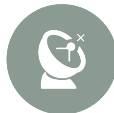
TELEKOMMUNIKATION, MEDIEN & TECHNOLOGIE